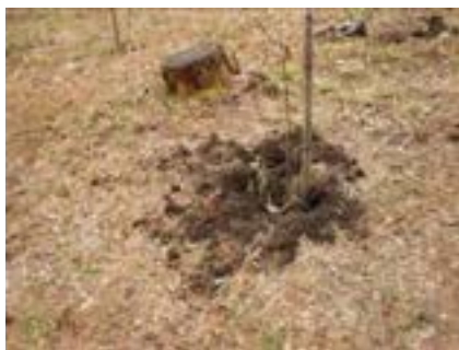
イノシシが掘り返した跡