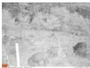
イノシシ（成長の森）