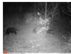
イノシシ（成長の森）