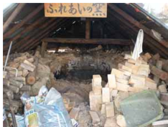
(すみ焼き釜の崩落)