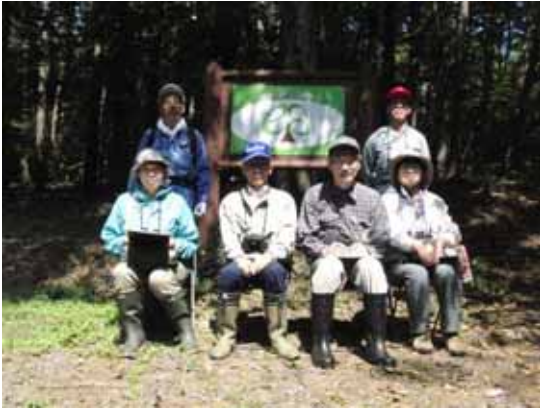
( 8月29日 )