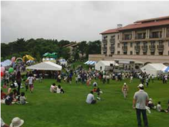
(会場のグランドエクシブ那須白河)

6月12日西郷村風評被害対策事業実行委員会の主催で、『福島、西郷は風評被害にまけません！「安心」「安全」「応援」をスローガンに、明日のため、これからの為に』復興イベントが開催されました。