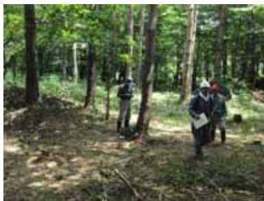
( 8月29日 )