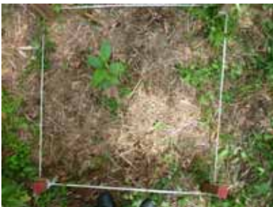
( 1m 四方の調査地 )